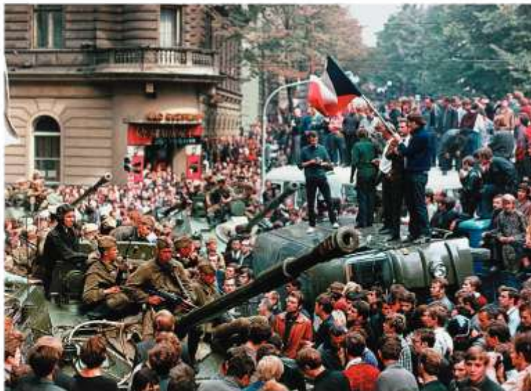
На улице Праги. Август 1968 г.

На рубеже 70—80-х гг. XX в. кризисные явления резко обозначились в Польше . Ухудшение положения населения