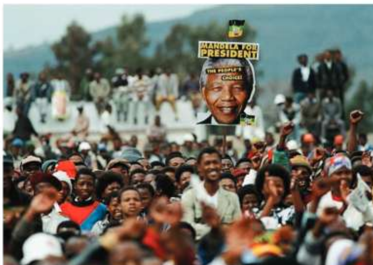
Предвыборный митинг в поддержку Н. Манделы в ЮАР. 1994 г.

В 70-е гг. XX в. крупные промышленные центры ЮАР были охвачены забастовками. Протест против расовой дискриминации поддерживали все категории цветного населения и некоторые группы белого населения, особенно студенты. Апартеид был осужден общественностью всего мира. Мандела стал символом освободительного движения ЮАР.