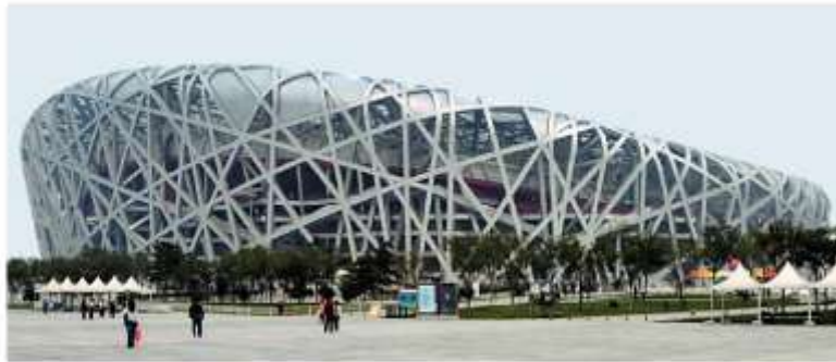
Олимпийские сооружения в Пекине

также создал атомное оружие), хотя, как и в Индии, значительная часть населения продолжает жить в нищете. В начале XXI в. участились выступления приверженцев усиления роли ислама в жизни общества.