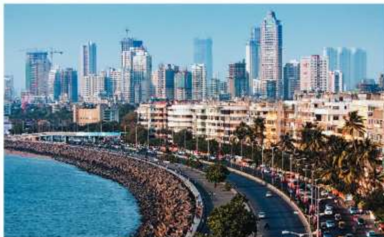
Индийский город Мумбаи (бывший Бомбей)

Для политического развития Пакистана характерна нестабильность. Большую роль в стране играла армия, часто совершавшая военные перевороты. Во внешней политике Пакистан придерживался проамериканского курса. Экономика страны развивалась сравнительно успешно (Пакистан