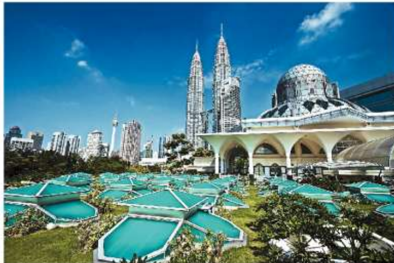
Столица Малайзии Куала-Лумпур

Основная часть стран «третьего мира» выбрала капиталистический путь развития . В этих странах принимались меры по развитию рыночной экономики, широко откры-